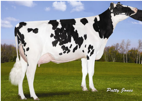
OCD MOGUL FUZZY NAVEL THIRD DAM